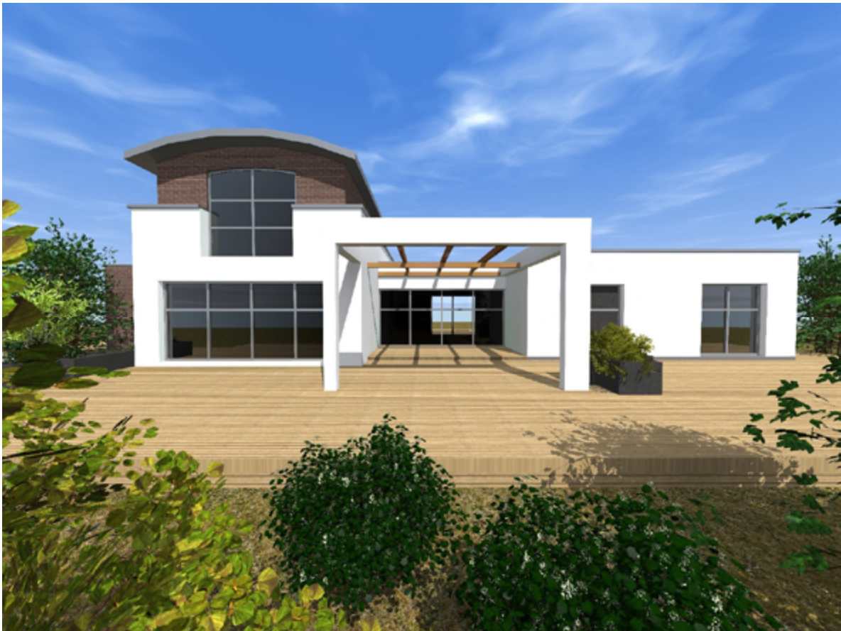
Haus Typ D Variante 1 Ansicht von Süden