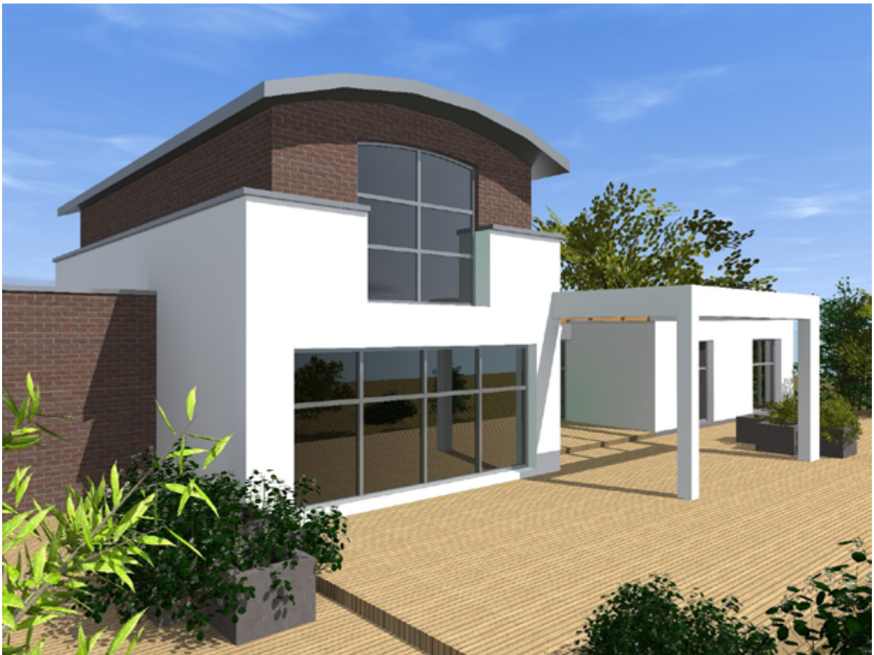
Haus Typ D Variante 1 Ansicht von Süden