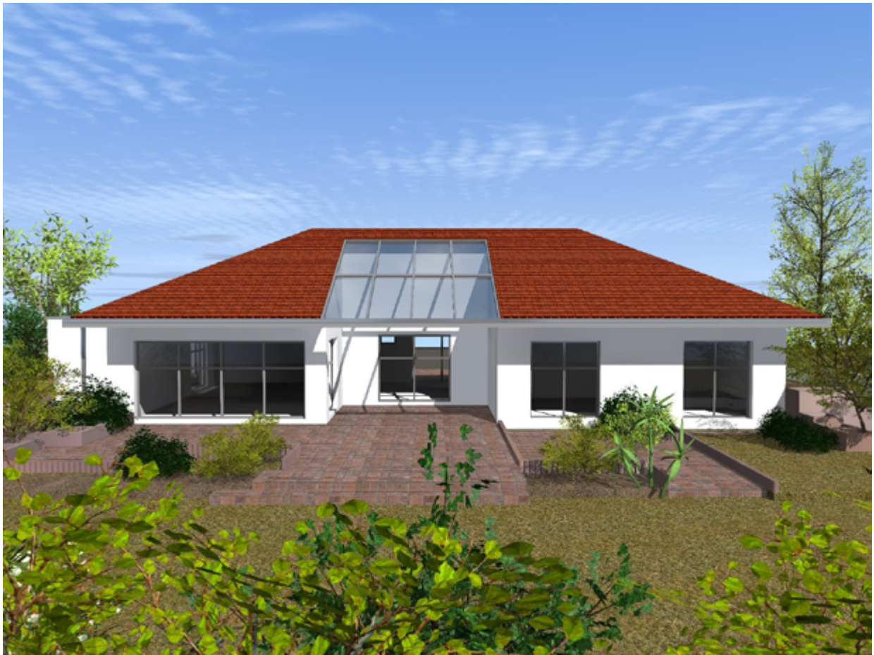
Haus Typ I Südensicht