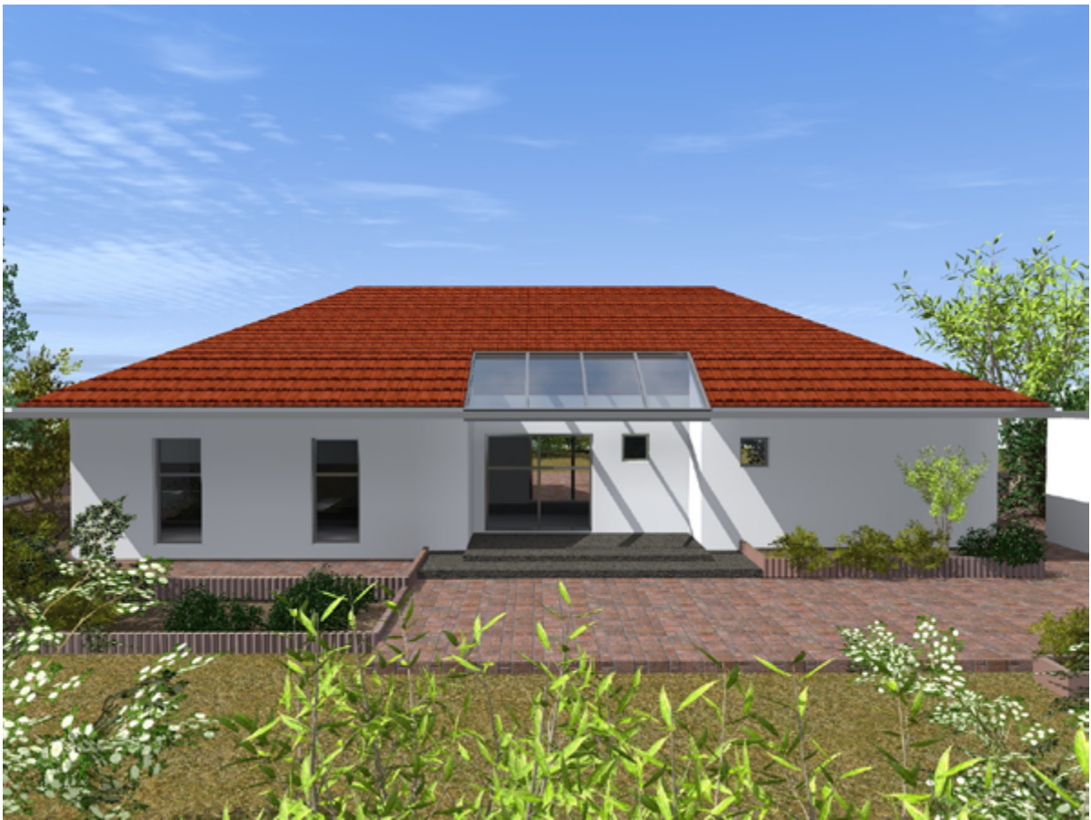
Haus Typ I Nordansicht